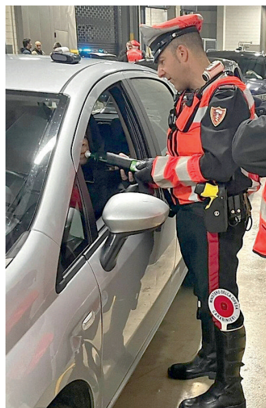
➤ I carabinieri nel sottopasso che dalla stazione Garibaldi porta in viale della Liberazione: nella prima corsia i veicoli di chi è sospettato di aver bevuto, nella seconda di aver assunto droga

uomo, con tre figli a casa e compagna e cane in auto, sa già qual è il suo destino. «Ho fatto una tirata di coca alle 5 a casa, ma sono lucidissimo. Fatemi l'alcol test o il test anti fumo. Ma dai, sono lucidissimo». Qualcuno invece si dispera meno. Una comitiva si scatta un selfie ricordo davanti all'Audi di un ragazzo di Montecarlo, anche lui positivo all'alcol.